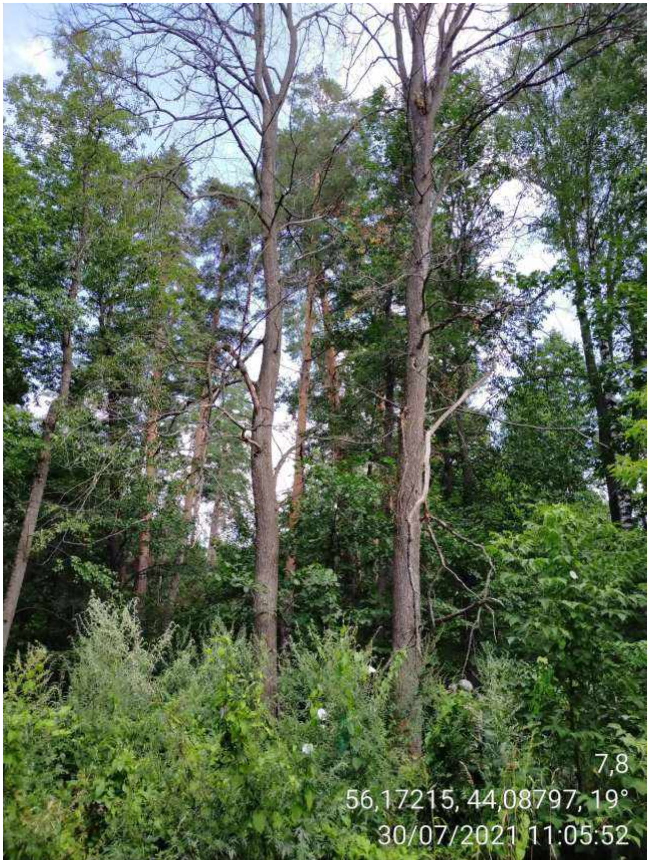
Дерево № 7,8